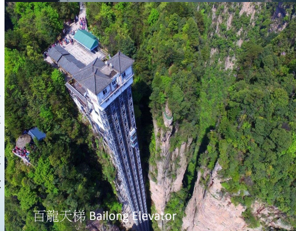
百龍天梯 Bailong Elevator